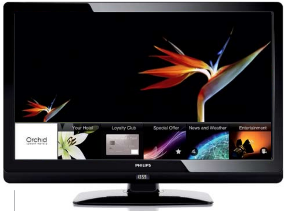
Interface utilisateur multimédia dynamique

Créer votre portail unique de communications client